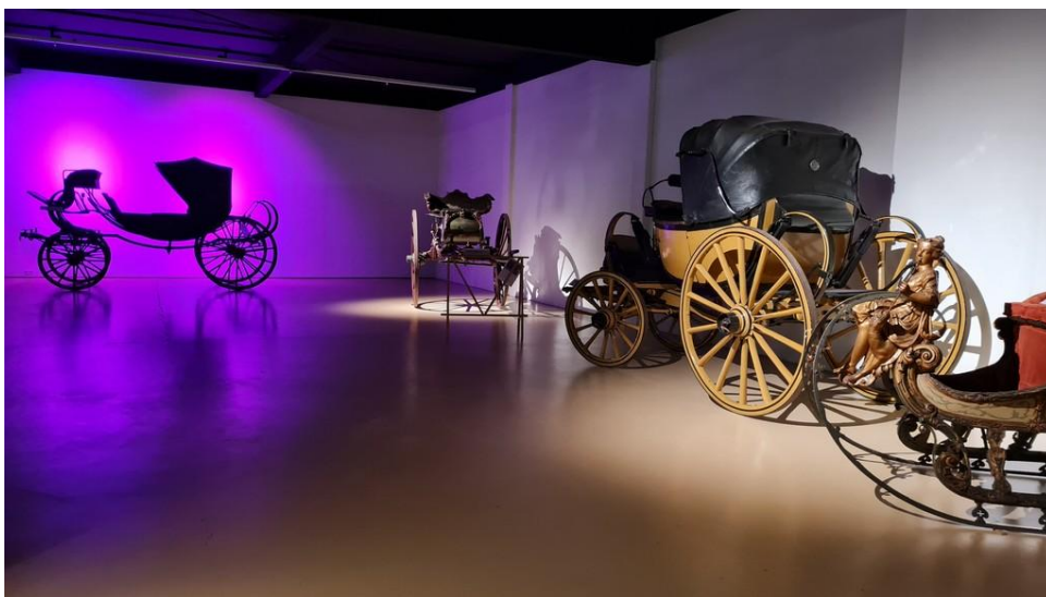
Stichting Hippomobiel Erfgoed Nienoord 1